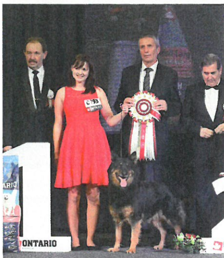
▲ Skupina neuznaných plemen FCI BIG 1 – chodský pes Irluka Krosandra, chov. L. Sloupský, maj. E. Sloupská a L. Sloupský